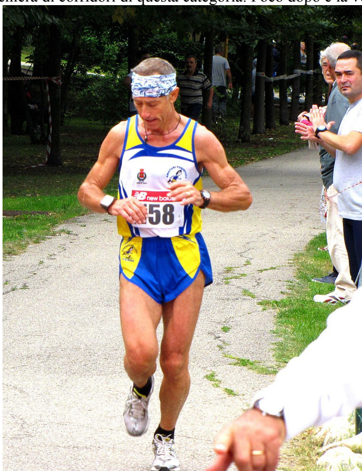
Alla corsa “Porta un amico planteremo un albero” nel 2012

Con la classica ‘Invernalissima 2012’ di km 21,097 a Bastia Umbra (Pg) si chiude in pratica la stagione. E’ una gara difficile con molti assi stranieri, vince il kenyota Julius Rono con 1h03’42” a 3’ di media