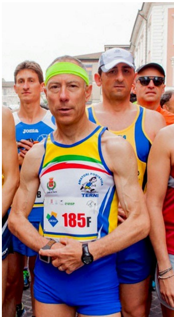
Partenza della Maratona delle Acque 2016

In attesa di trovare l'occasione buona negli SM55, si prosegue con varie corse tra cui il "Giro d