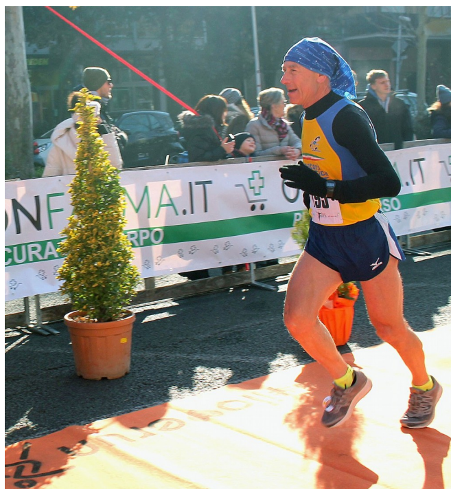
Al "Trofeo Braconi -Terni Half Marathon" del 2020

Per raggiungere l'obiettivo di preparare per il 2020 una buona gara di maratona come classifica assoluta, gareggiando come atleta SM60, sono in programma due partecipazioni a gare molto diverse.