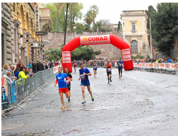
Maratona di Roma – passaggio in via IV novembre