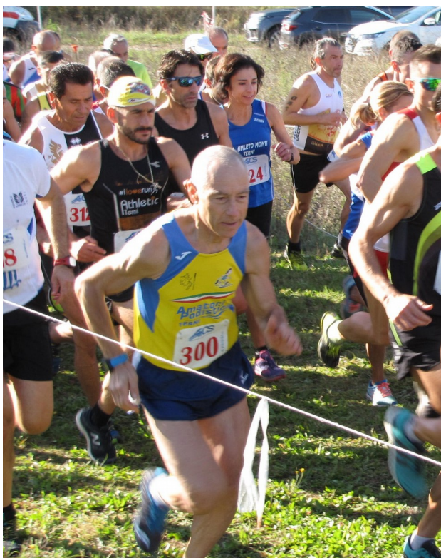
Partenza di una gara di Cross