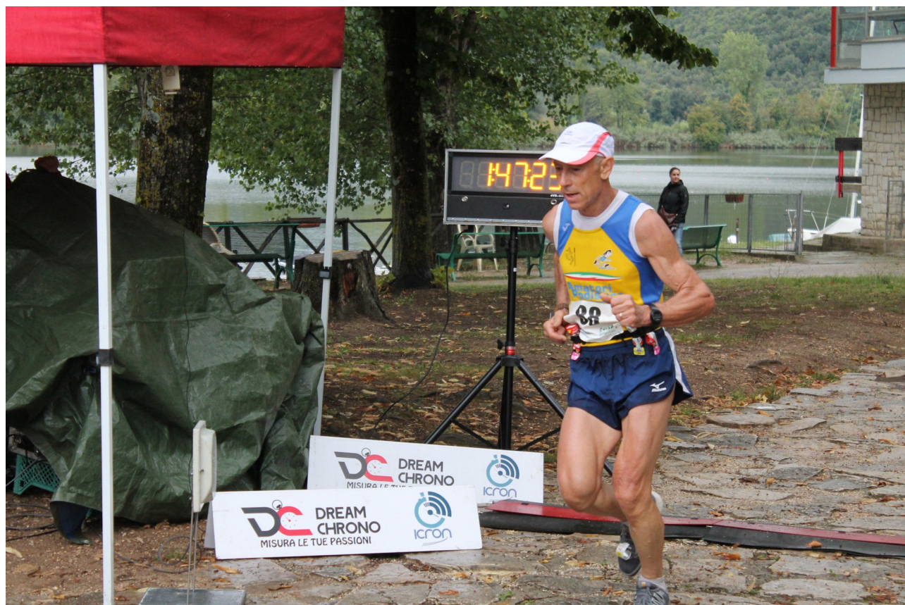
Alla corsa "Maratona Giro del Lago di Piediluco" del 2019, fatta sotto la pioggia