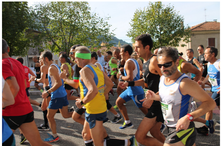
Partenza di gara, con l'avvio di tutti i podisti